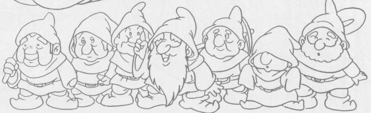
Seven dwarfs 7人の小人達